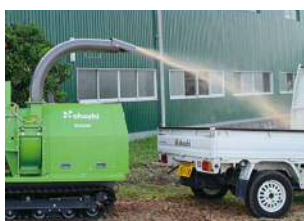
Scarica in camion