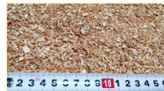
Vaglio a fori di 12 mm

Diverse dimensioni di cippato per soddisfare tutte le esigenze. Scegli la dimensione dei fori del vaglio in base alle proprie esigenze.