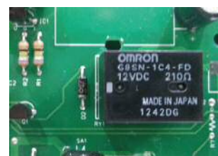
Dispositivo No Stress elettronico