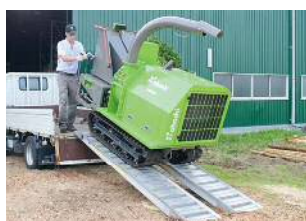
Carica facile su un camion