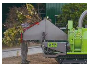
Rami frondosi OK