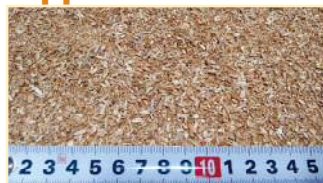
Vaglio a fori di 6 mm